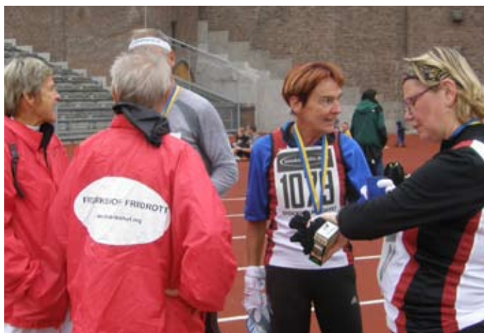
Eftersnack på Stadion.

-Allvarligt det här, vi måste nog ta upp en anmälan... -Men hunden var ju bara inne en sån här bit på gräsmattan, det syns ju inget ens. Eller är det Nordan som går igenom gatuavspärningarna med poliserna före loppet? Vi som vet vilka svåra avtryck barfotalöpning ger på Stadions gräsmatta undrar ju hur det ligger till egentligen. Fotbollspelarna kan ju skada sig allvarligt om de snubblar.