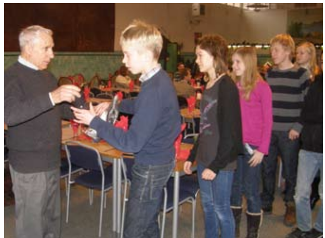
Det blev snabbt kö till julklapparna.