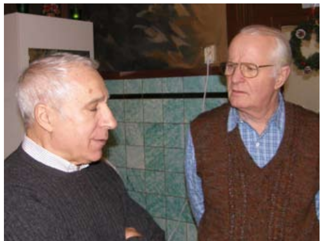
-Men du Vargas, hur ska vi organisera det här då? Delar du ut klapparna? -Lugnt!