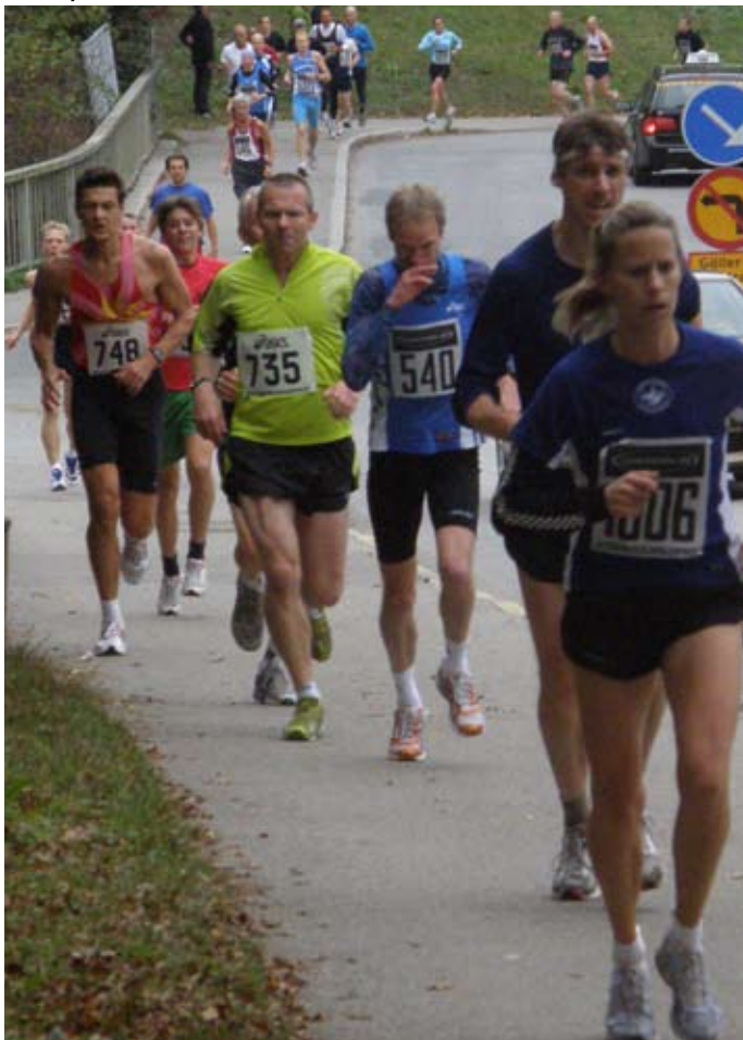
Klunga vid backen, Ryttestadion, med drygt ett varv kvar.

Vår äldsta arrangemang, det första gick 1927. Årets upplaga gick den 6 oktober. Som mest har Stockholmsloppet haft 13.500 deltagare i mitten på 90-talet. Årets antal var det mer normala 500-talet, ungefär som 2006 års lopp. Här följer några bilder från loppet. Nästa Stockholmslopp går den 4 oktober och byter namn till Stockholmsmilen.